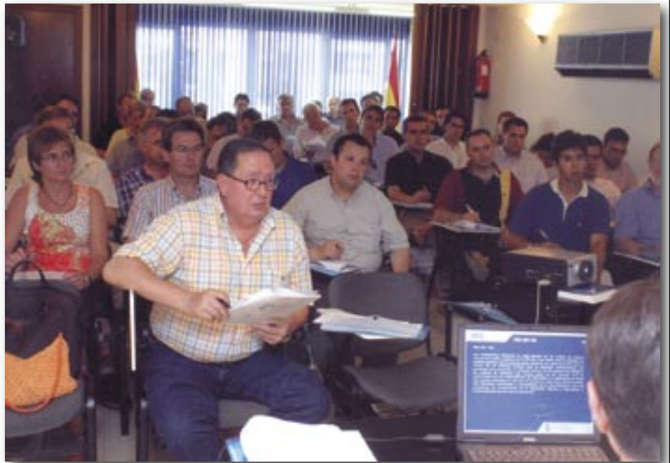
Participantes en la jornada del Colegio de Alicante.