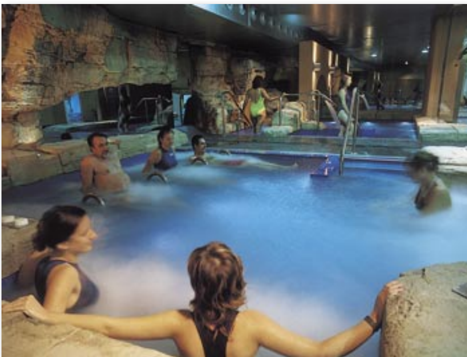
Piscinas termales del SPA.

La demarcación de Valencia ha suscrito un acuerdo con el Spa Calma por el que tanto los colegiados como los empleados del Colegio tendrán un 15% de descuento en el circuito termal y un 10% en el resto de sus servicios. Para ello, las personas interesadas deberán identificarse en el Spa, bien como colegiados o empleados del Colegio de Ingenieros , y realizar su reserva con antelación.