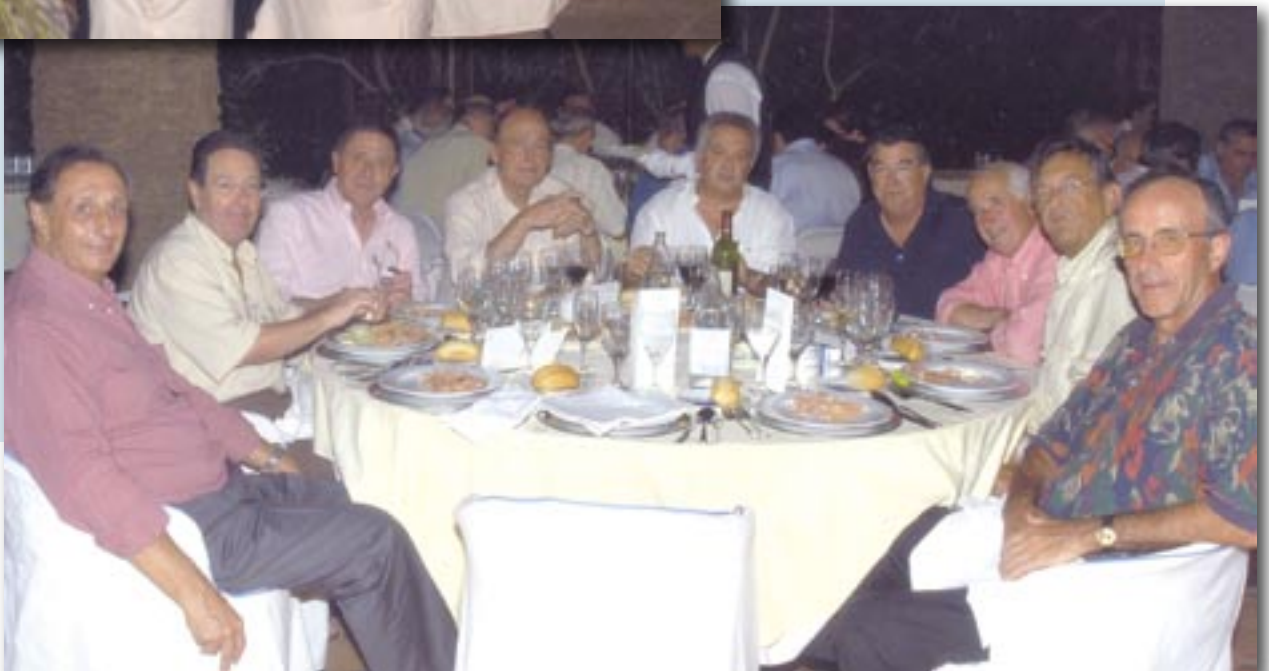
Miembros de la Junta Provincial de Castellón.