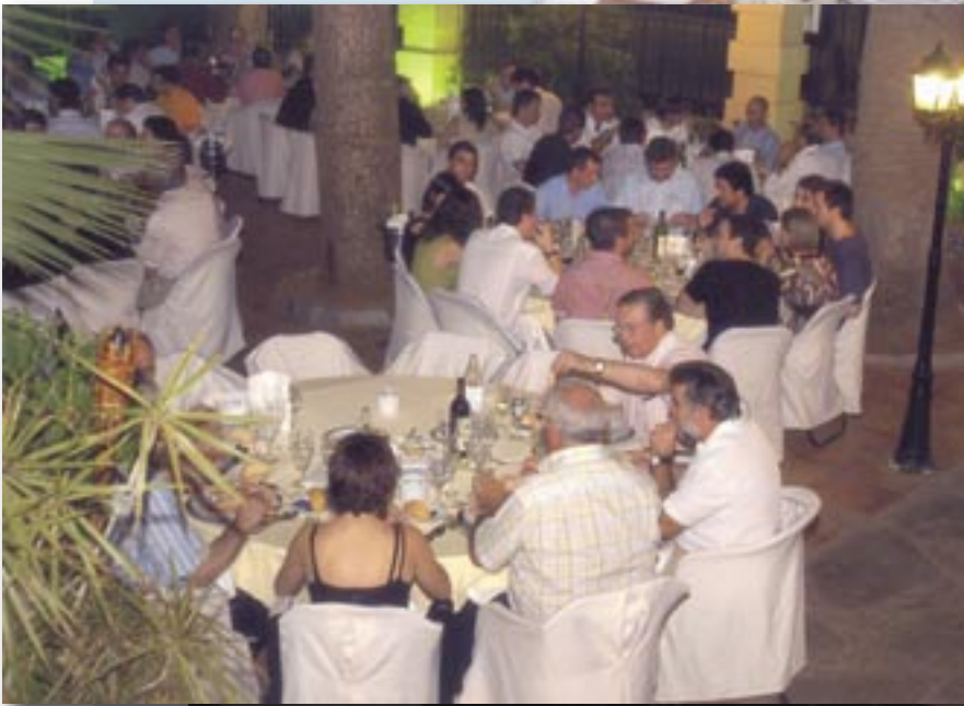
Asistentes a la cena de verano.