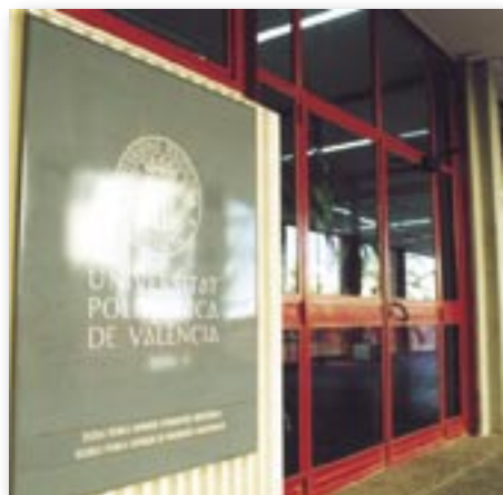
Instalaciones de la ETSII en Valencia.